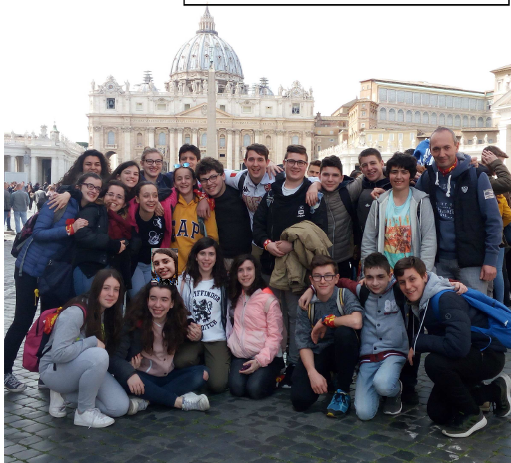
FOTO DI GRUPPO PELLEGRINAGGIO A ROMA RAGAZZI DI TERZA MEDIA CON EDUCATORI DI LAVENO MOMBELLO

Il Giovedì Santo - Messa in Coena Domini €. 537,67